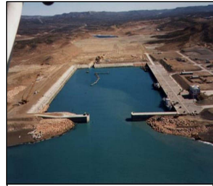
En Caleta Paula, Provincia de Santa Cruz, Argentina, y en una superficie de 12.000m2 se ubica el moderno astillero con una plataforma elevadora de buques de unas 10.000tons.

Así, dijo Tettamanti, “en Caleta Paula, se dispondrá de capacidad suficiente tanto para la construcción de buques pesqueros, petroleros y de artefactos de apoyo a la actividad offshore, como para el mantenimiento y la logística que requieren las flotas actuales, con una proyección que incluye al Atlántico Sur y el Pacífico Sur, también”, aseguró.-